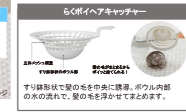
※詳細はカタログ参照

凹凸が少なく、汚れが落としやすい形状なのでお掃除がラクラク。さらにトラップカバーを開けて見える部分すべてが抗菌・防カビ効果を持つ樹脂で、ぬめりやカビ汚れの増殖を抑えます。