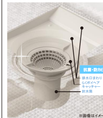
※詳細はカタログ参照